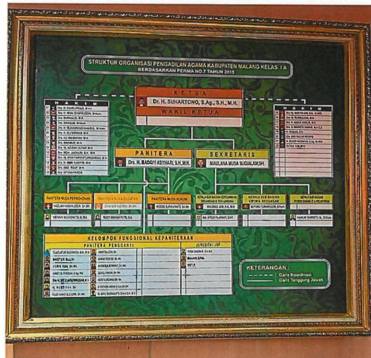
Papan Struktur Organisasi 2022